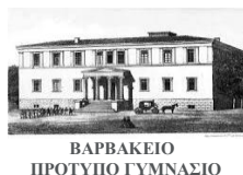
ΒΑΡΒΑΚΕΙΟ ΠΡΟΤΥΠΟ ΓΥΜΝΑΣΙΟ