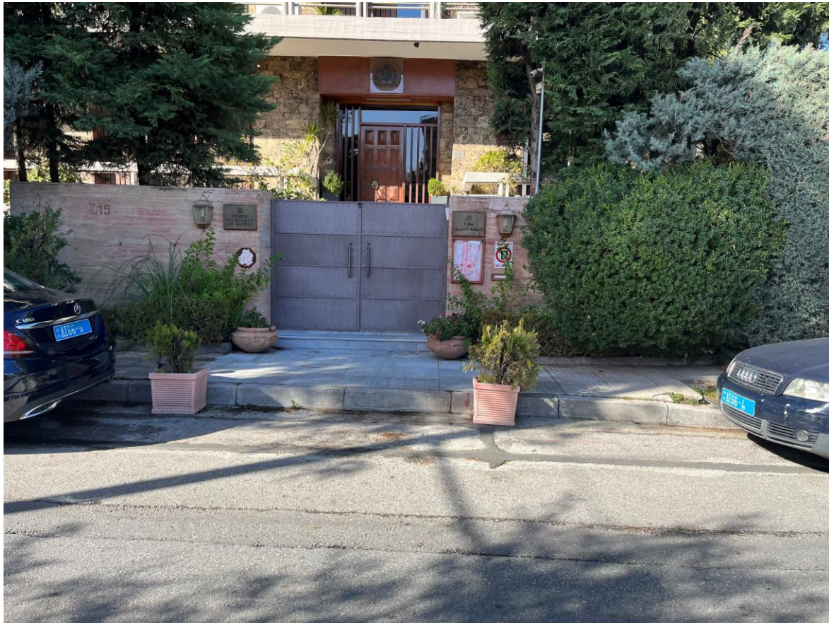
ΚΑΤΟΙΚΙΑ ΠΡΕΣΒΗ ΤΟΥ ΜΑΡΟΚΟΥ (ΒΑΣ. ΓΕΩΡΓΙΟΥ 8 & 25 ης ΜΑΡΤΙΟΥ 21 – ΦΙΛΟΘΗ) 1.