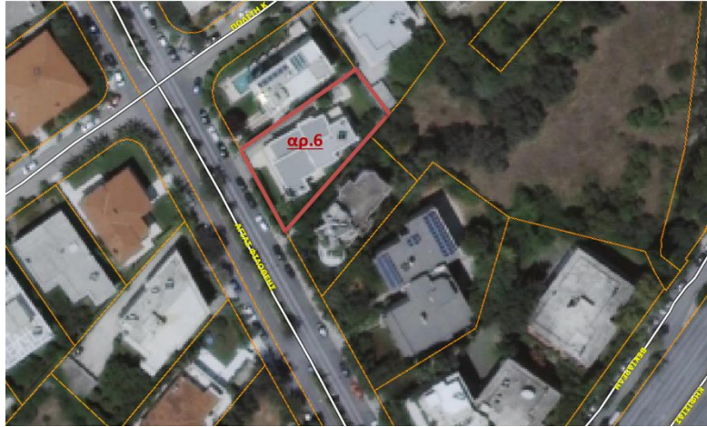
Εικόνα 1: Ιδιοκτησία επί της Λεωφ. Αγίας Φιλοθέης αρ.6, στη Δημοτική Ενότητα Φιλοθέης. (Φωτογραφικό απόσπασμα του Κτηματολογίου).