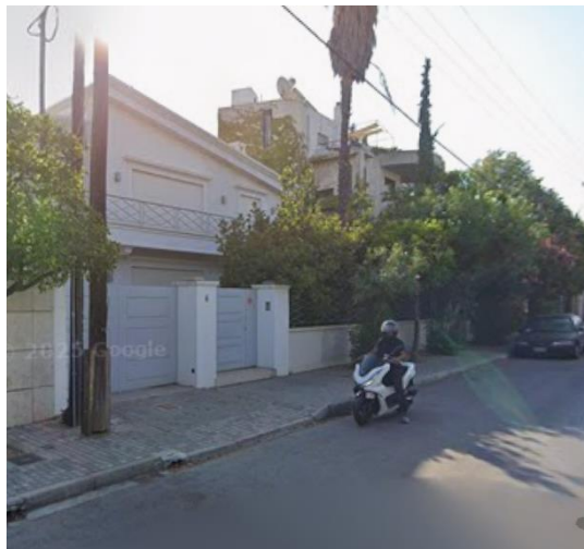
Εικόνα 2: Ιδιοκτησία επί της Λεωφ. Αγίας Φιλοθέης αρ.6, στη Δημοτική Ενότητα Φιλοθέης. (απόσπασμα από την ιστοσελίδα "Google Maps").

3) Έμπροσθεν της Πρεσβευτικής Κατοικίας υφίσταται στάση αστικού λεωφορείου [Εικόνα 3], όπου απαγορεύεται η στάση ή στάθμευση οχήματος σε απόσταση μικρότερη από δώδεκα (12) μέτρα εκατέρωθεν αυτής, σύμφωνα με το άρθρου 38 του ν. 5209/25 (ΦΕΚ-100 Α/13-6-25) – Κύρωση του Κώδικα Οδικής Κυκλοφορίας.